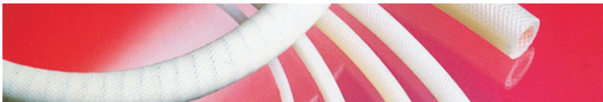
Siliconschläuche mit Gewebeeinlage und Ummantelung.

Obwohl die Standard-Lagerschläuche überwiegend transparent sind, primär um die Anforderungen der Pharma-, Lebensmittel- und Getränkeindustrie zu erfüllen, sind auf Anfrage auch andere Farben und Ausführungen wie z.B. Glasseiden oder Aramid-Faser Einlagen erhältlich.